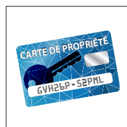
Carte de propriété