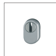
Rosace de sécurité inox ou blanche