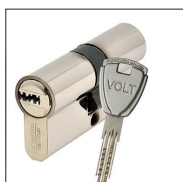
Cylindre de sécurité 6 clés