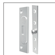
Doigt anti-soulèvement côté paumelles