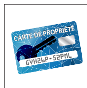
Carte de propriété